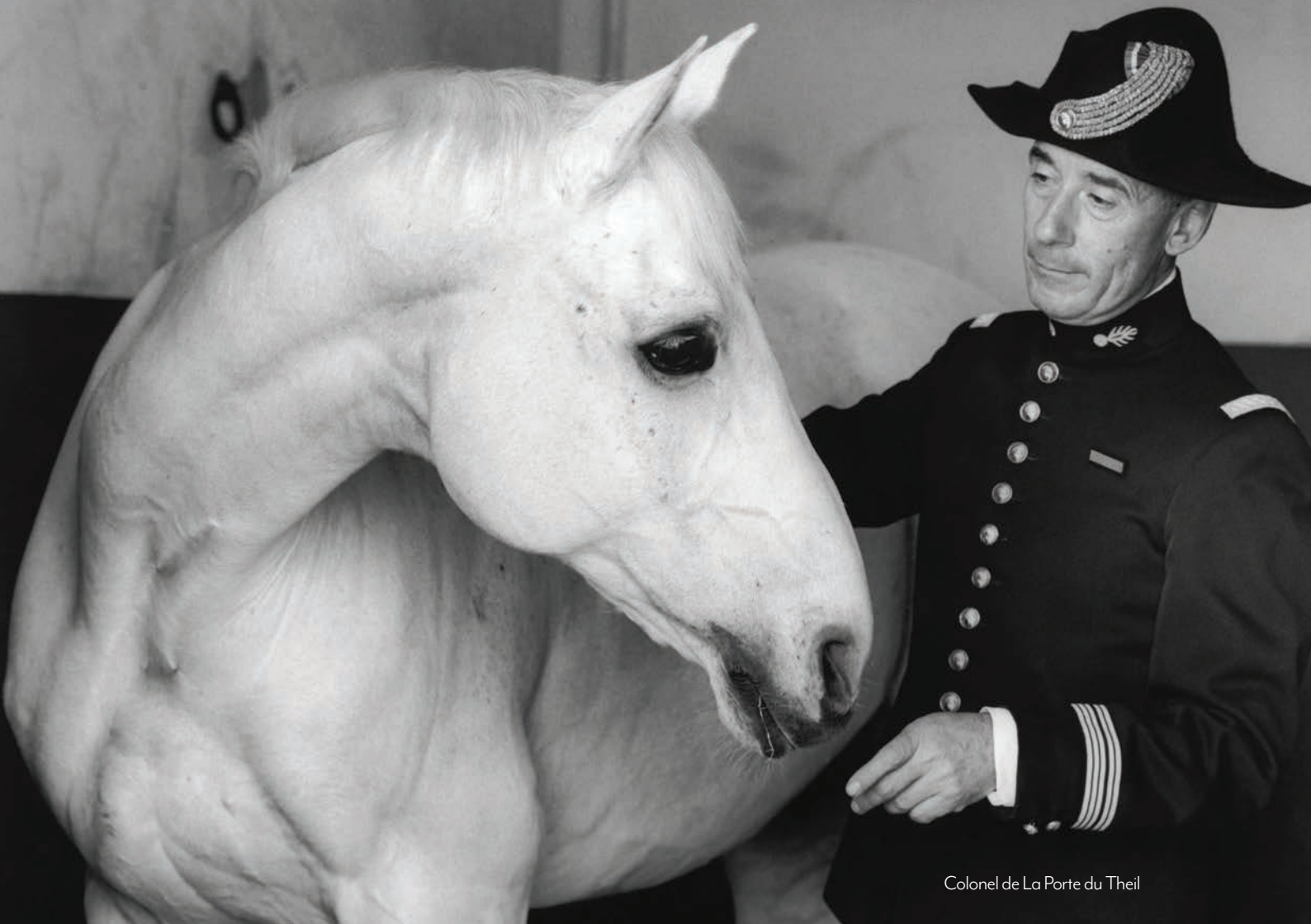
Colonel de La Porte du Theil