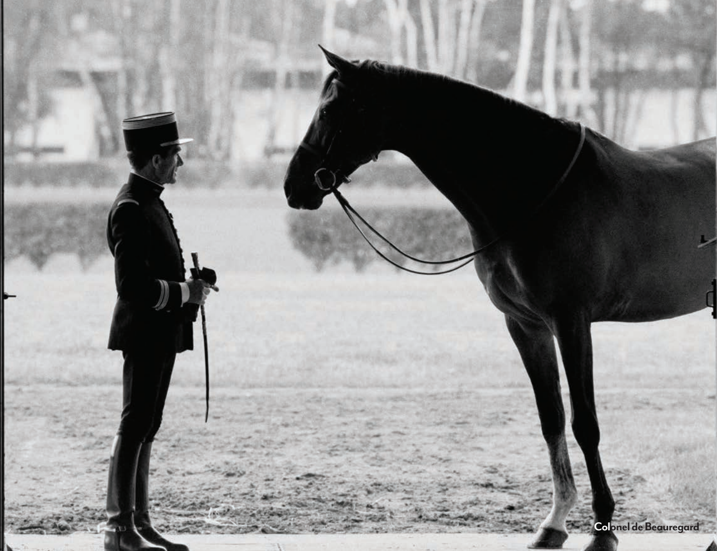
Colonel de Beauregard